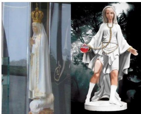
Mutum-mutumin Fatima da Hoton Abin da Yara suka gani a 1917

Zai yiwu bayyanar Fatima ta kasance Maryamu ko diyar Muhammadu?